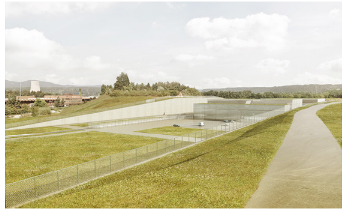
Bild 4: Mögliche Einbindung der Oberflächenanlage in die Umgebung (fotorealistische Darstellung)

Die detaillierte Planung der Erschliessung erfolgt in einer späteren Phase. Gemäss heutiger Planung ist vorgesehen, einen Bahnanschluss an die Oberflächenanlage mit Unterführung unter der Kantons-