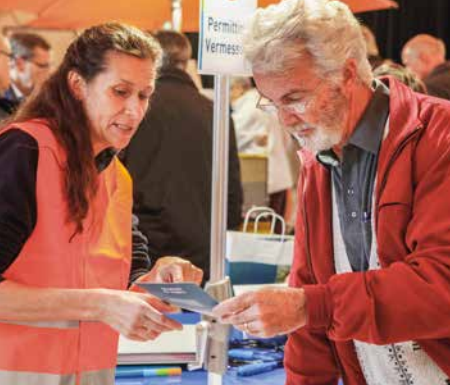
Information der Bevölkerung